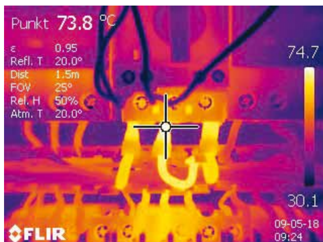
Termografi afslører defekter, inden der opstår brand i elinstallationerne.

Spørg din assurandør om termografi og el-eftersyn.