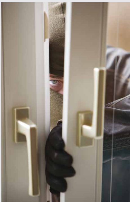
Slip for ubudne gæster – benyt tilbuddet og få en G4S Privatalarm for 600 kr., som NærBrand efterfølgende refunderer.

Når du sender en sms, deltager du samtidig i konkurrencen om en flot forårskurv med vin, lækkerier til ganen og frø til haven. Vinderne får direkte besked.